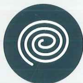
Serpents à l'extérieur