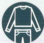
Vêtements amples et couvrants